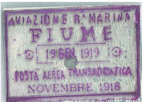
AVIAZIONE Rª MARINA FIUME 19 Gen. 1919