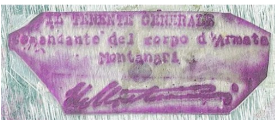
IL TENENTE GENERALE