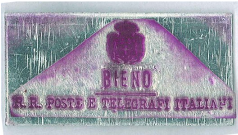
BIENO R.R. POSTE E TELEGRAFI ITALIANI