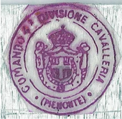
COMANDO 4ª DIVISIONE CAVALLERIA °(PIEMONTE)°