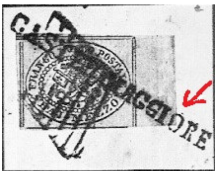
“Castelmaggiore” falso su francobollo annullato con griglia originale del 1855