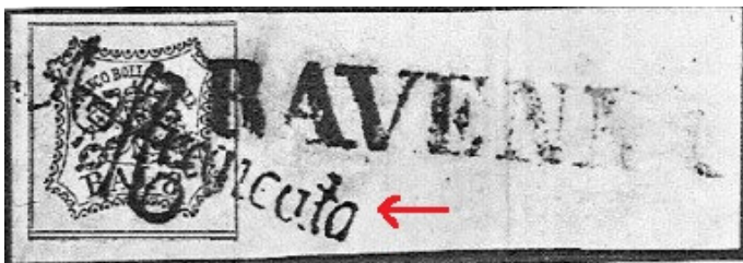
“AFFRANCATA” falso in rosso in corsivo tondo,

Aggiungiamo anche alcune impronte false, discretamente imitate, di Pontificio usate su documenti e/o frammenti: