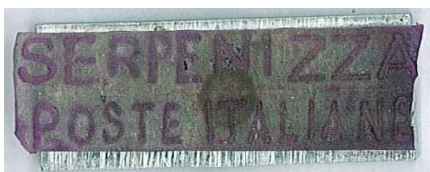
SERPENIZZA POSTE ITALIANE