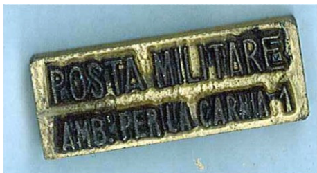
POSTA MILITARE AMB. PER LA CARNIA 1