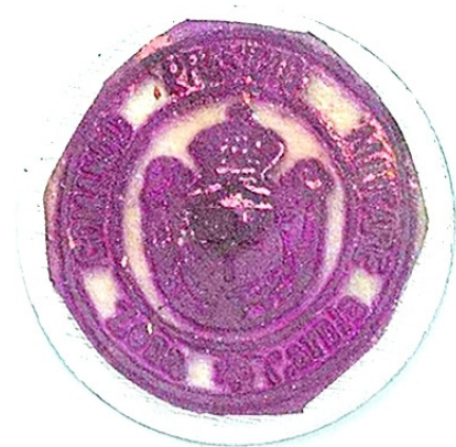
COMANDO PRESIDIO MILITARE Zona Carnia