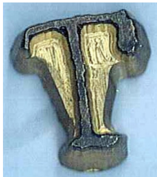
Due "T" di tassate in caratteri diversi