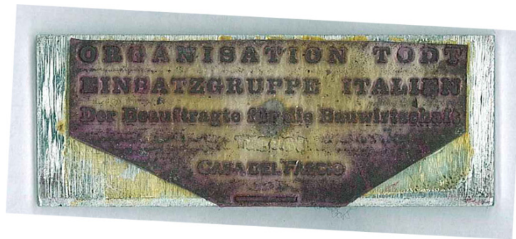
ORGANISATION TODT EINSATZGRUPPE ITALIEN Der Beauftragte für Sie Bauwirtschaft CASA DEL FASCIO